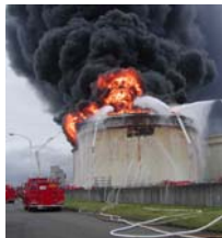
Brand nach einem Erdbeben in der Türkei 1999 →