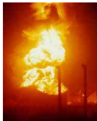
← Die Folgen eines Erdbebens in Japan 2003