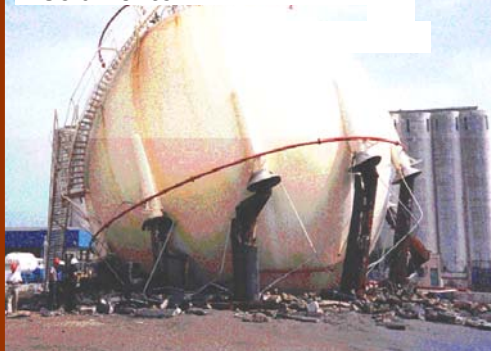
Fevereiro – Corrosão sob Isolamento