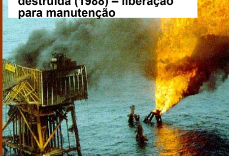
Julho – Piper Alpha destruída (1988) – liberação para manutenção