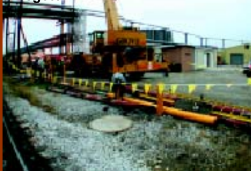
Agosto – reação tóxica em esgoto