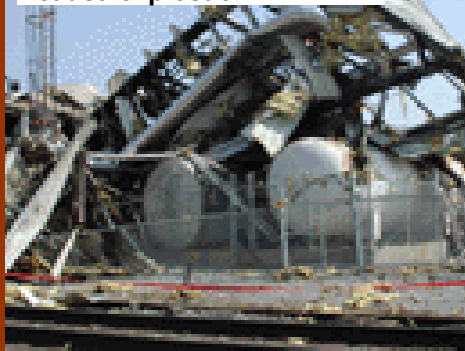
Abril – Sobreaquecimento causa explosão