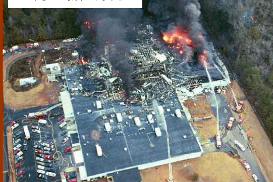
5月 - 粉塵爆発