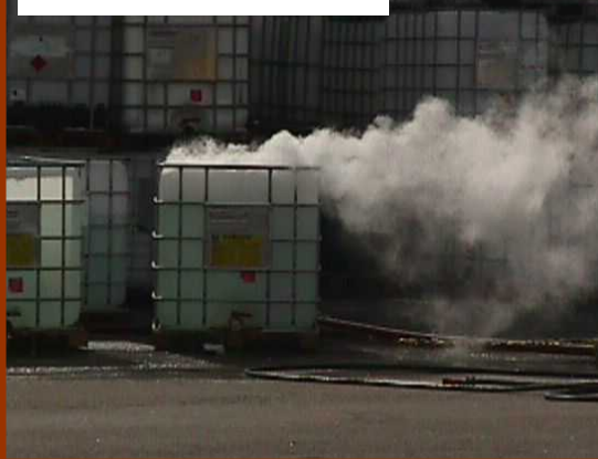
1月 - 経時変化性薬品