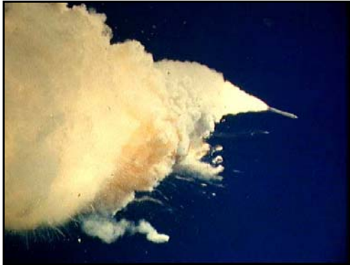
ינואר 1986 . החללית צ'לנג'ר מתפוצצת בהמראה