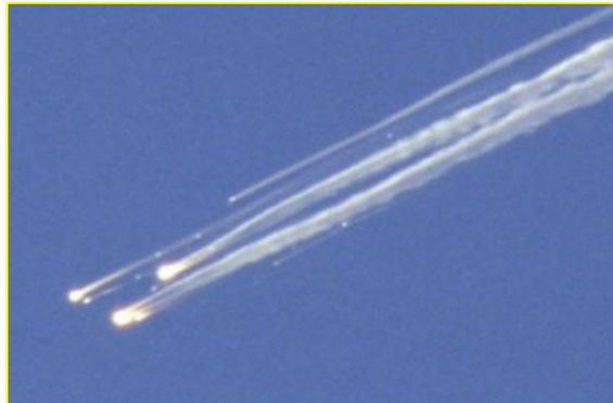
פברואר 2003 , החללית קולומביה מתפרקת תוך חזרה וכניסה לאטמוספירה.