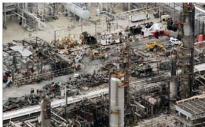
มีนาคม 2005, Texas City, Texas เกิดการระเบิดในโรงกลั่นน้ำมัน Texas oil

อะไรคืออุบัติเหตุการณ์และอุบัติเหตุ มันเป็นเรื่องที่เกิดจากความซับซ้อนของความผิดพลาดของระบบต่างๆ เช่นนั้นหรือ? แต่จากการสอบสวนอุบัติเหตุพบว่าสาเหตุของอุบัติเหตุเหล่านั้นมาจากวัฒนธรรมองค์กรด้านความปลอดภัย แต่อะไรคือวัฒนธรรมความปลอดภัย? โดยความของสมาคมความปลอดภัย อาชีวอนามัย ประเทศอังกฤษให้คำจำกัดความไว้ว่า " ... เป็นคุณค่า ที่ศรัทธา ความสามารถและแบบอย่าง ของบุคคลและกลุ่มของลักษณะในการสร้างลักษณะนิสัยด้านความปลอดภัยและอาชีวอนามัย." คำจำกัดความดูแล้วค่อนข้างจะยุ่งยาก เพราะฉะนั้นทาง CCPS ได้แนะนำว่าคำจำกัดความดังนี้ "วัฒนธรรมความปลอดภัยคือองค์กรที่มีการปฏิบัติด้านความปลอดภัยจนเป็นนิสัย โดยไม่ต้องมีใครต้องจับตามอง" ในขณะที่เดียวกันผู้บริหารขององค์กรจะต้องเป็นผู้นำในด้านวัฒนธรรมด้านความปลอดภัยและพนักงานทุกคนต้องมีส่วนร่วมในการสร้างวัฒนธรรมองค์กรด้านความปลอดภัย ในบทความของ Beacon จะให้ความสำคัญด้านวัฒนธรรมด้านความปลอดภัย - โดยการรักษาความรู้สึกที่รู้ถึงความไม่มั่นคง ( maintaining a sense of vulnerability )