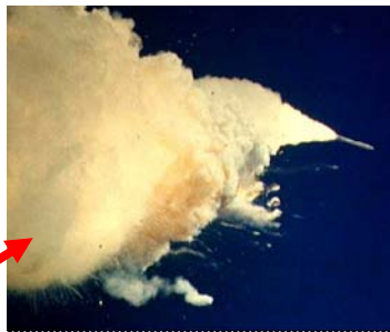
Juni: Budaya Keselamatan