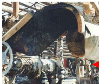
November: Penggetasan karena Dingin