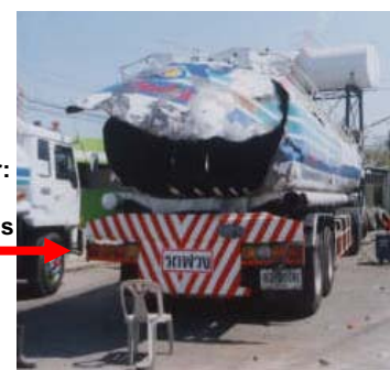
September: Izin Kerja-Panas