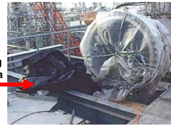
Agustus: Ruang Terkurung Sementara