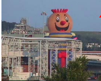
April: Tanggap Darurat