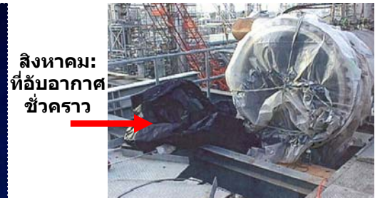
สิงหาคม: ที่ฉีกอากาศ ชั่วคราว