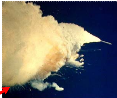
มิถุนายน: วัฒนธรรม ความปลอดภัย