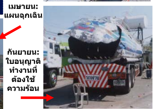
เมษายน: แผนฉุกเฉิน