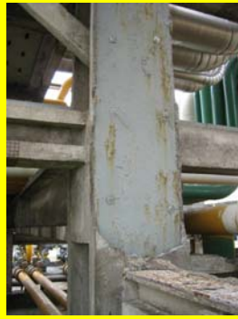
می - آسیب دیدگی پوششهای نسوز در ستونهای پل