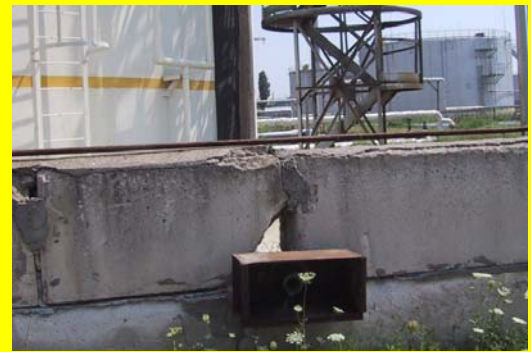
ژوئن - سوراخ ایجاد شده در Dike Wall

آیا میتوانید تشخیص دهید که چه چیزی در نشریه Beacon در ماههای ژوئن، آوریل و می مشترک است؟ در هر سه شماره درباره تجهیزات ایمنی منفعل (غیر فعال) بحث شده است. هدف از نصب تجهیزات ایمنی منفعل تشخیص شرایط نایمن و انجام اقدام عملیاتی نیست. این تجهیزات دارای سنسور و قطعات متحرک نبوده و به دلیل ساختارشان ایفای نقش می کنند به عنوان مثال پوششهای نسوز (Fireproof) به دلیل ویژگیها و ضخامت عایق کاری و دیوارهای Dike به دلیل ارتفاع و غیر قابل نفوذ بودنشان نقش تجهیزات ایمنی را دارند. در اینجا مثالهای از تجهیزات ایمنی منفعل که احتمالاً در واحد تحت نظارت شما وجود دارند آورده شده است: دیوارهای بازدارنده و محدود کننده جهت مواد سمی، ساختمانها و اتاقهای کنترل که مقاوم در برابر انفجار هستند، ساختمانهای مقاوم در برابر انفجار جهت ذخیره موادی مانند پراکسیدهای آلی که پایدار نیستند، بازدارنده های شعله و انفجار و عایق کاری مخازن به منظور کاهش اثرات ناشی از تاثیر حرارت (انتخاب استاندارد اندازه شیرهای اطمینان به منظور جلوگیری از افزایش فشار در هنگام آتش سوزی در مخازن ذخیره).