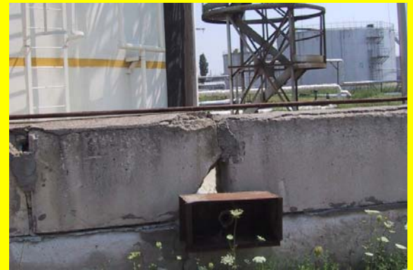
Junho – buraco numa parede de um dique de contenção de um tanque

O que têm em comum os Process Safety Beacons de Abril, Maio e Junho de 2010 têm? Todos eles são sobre um tipo de equipamento de segurança geralmente descrito como equipamento de protecção passiva . Equipamentos de segurança de protecção passiva não têm que detectar uma condição insegura ou tomar qualquer acção a fim de desempenhar sua função de segurança. Não possuem sensores ou partes móveis. Eles desempenham as suas funções por causa das suas características construtivas – por exemplo, características de isolamento, espessura de isolamento, ou protecção contra incêndios ou ignifugação, ou a altura e a característica de isolamento dos materiais de construção de uma parede de uma bacia de contenção.