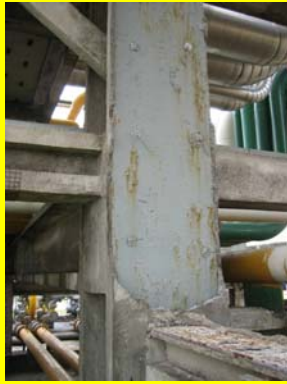
Maio – ignifugação danificada numa coluna de suporte de uma estrutura de tubagens