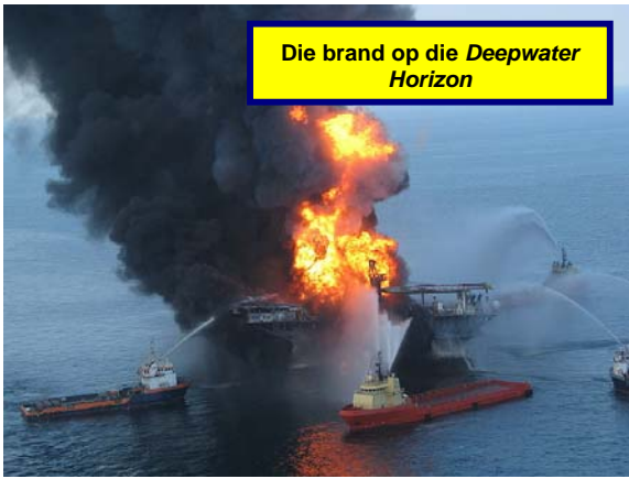
Die brand op die Deepwater Horizon