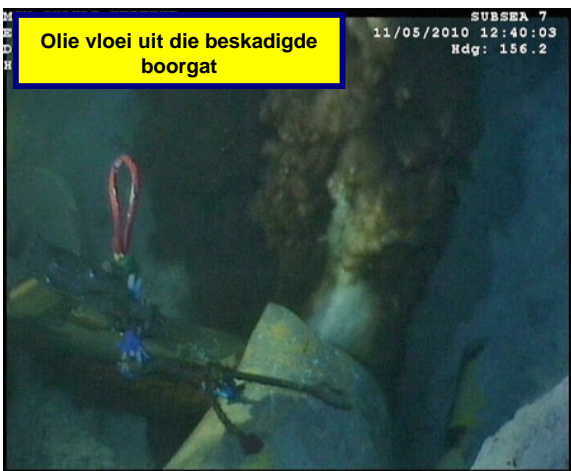
Olie vloei uit die beskadigde boorgat