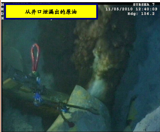
从井口泄漏出的原油