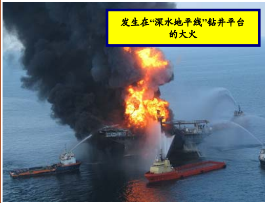
发生在“深水地平线”钻井平台的大火