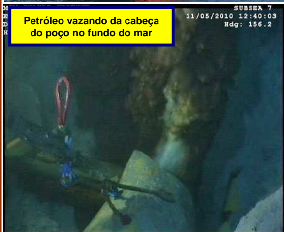
Petróleo vazando da cabeça do poço no fundo do mar