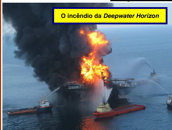
O incêndio da Deepwater Horizon