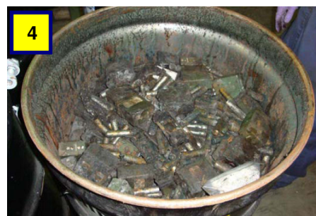
圖4 - 包裝不當的廢鋰電池，當運往廢棄物處理場時著火。

圖3 - 某種活性的單體(monomer)被錯放入沒有正確內襯的鐵路槽車內，從槽車污染到鐵而起聚合反應，造成槽車爆炸。