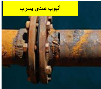
أنبوب صدئ يسرب