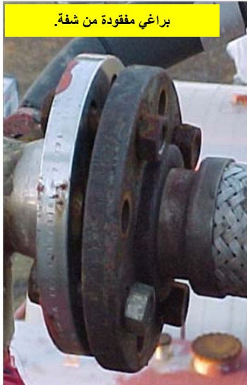
براغي مفقودة من شفة.