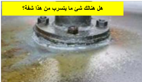
هل هناك شيء ما يتسرب من هذا شفة؟