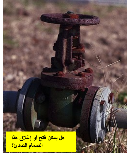
هل يمكن فتح أو إغلاق هذا الصمام الصديء؟

تظهر الصور أمثلة على المشاكل التي قد تلاحظها في المصنع الخاص بك.