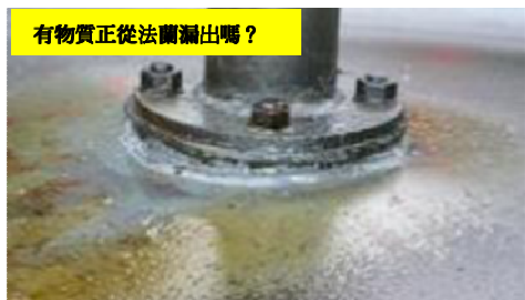
有物質正從法蘭漏出嗎？