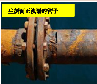
生鏽而正洩漏的管子！