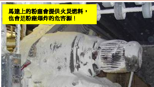
馬達上的粉塵會提供火災燃料， 也會是粉塵爆炸的危害源！