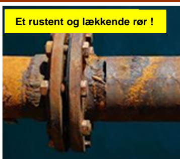
Et rustent og lækkende rør !