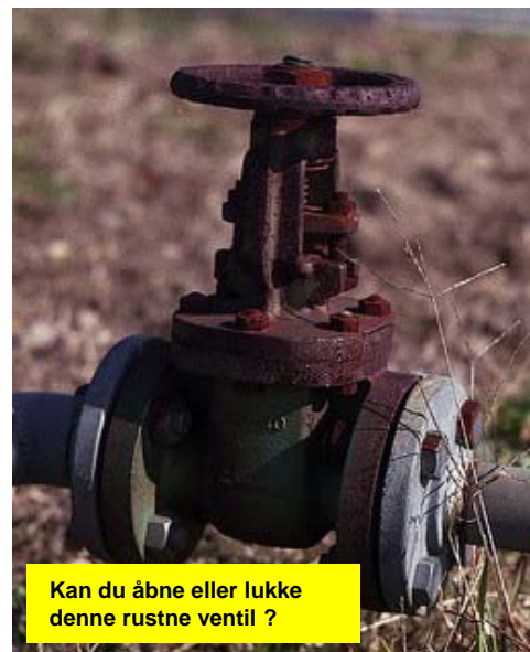
Kan du åbne eller lukke denne rustne ventil ?

Billederne viser nogle eksempler på problemer du måske ser i dit anlæg.