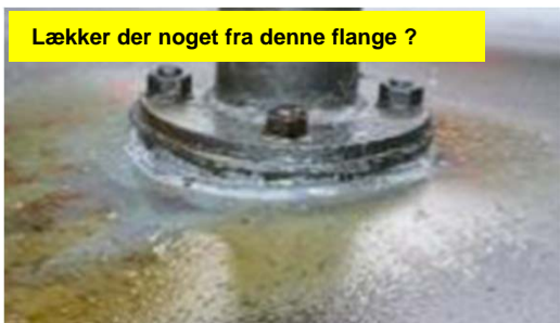
Lækker der noget fra denne flange ?