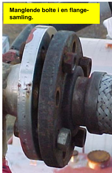
Manglende bolte i en flangesamling.