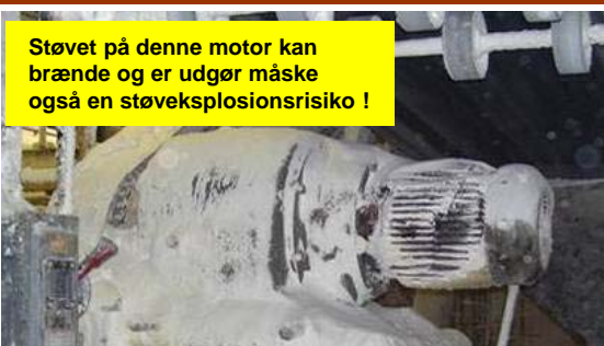
Støvet på denne motor kan brænde og er udgør måske også en støveksplisionsrisiko !