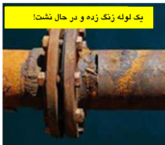
یک لوله زنگ زده و در حال نشت!