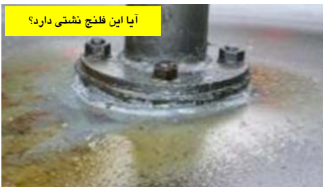
آیا این فلنج نشتی دارد؟