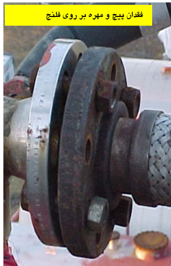
فقدان پیچ و مهره بر روی فلنج