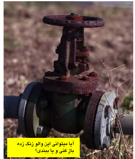
آیا میتوانی این والو زنگ زده باز کنی و یا ببندی؟

همیشه از سوی کارکنان این سوال مطرح است که "من چه کاری میتوانم برای بهتر شدن وضعیت ایمنی انجام دهم؟ من فقط یک اپراتور، تکنسین، نمونه بردار، متصدی تجهیزات، بازبین هستم" این واقعیتی است که کارکنان و پرسنل تعمیرات نمی توانند فرایند شیمیایی، طراحی تجهیزات و یا مواد مصرفی را تغییر دهند. اما این افراد بهتر از هر کسی فرایند را می شناسند. آنها می دانند فرایند چگونه عمل می کند، چگونه تجهیزات از سرویس خارج می شوند و تحت چه شرایطی فرایند بهترین عملکرد را دارد. "یوگی بررا" یک بازیکن بیس بال بود و می گفت: "شما با تماشا کردن می توانید مطالب زیادی فرا بگیرید" این مطلب در ایمنی فرایند نیز صادق است. شما می توانید بر اساس مشاهدات و گوش کردن مطالب زیادی را یاد بگیرید. صداهای غیر طبیعی حاکی از بروز مشکل در تجهیزات است. آثار رطوبت و کثیفی بر روی زمین حاکی از نشتی است. همگی می دانیم که مشکلات مربوط به تجهیزات و نشتی ها به خودی خود رفع نمی شوند. این گونه مشکلات را گزارش کنید، فرم درخواست تعمیرات بنویسید و یا به سرپرست خود اطلاع دهید. در تصاویر زیر برخی از مشکلات که احتمالاً در واحد خود مشاهده خواهید کرد نشان داده شده است.