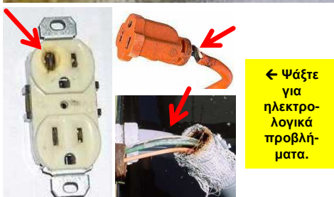
← Ψάξτε για ηλεκτρολογικά προβλήματα.