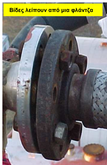
Βίδες λείπουν από μια φλάντζα