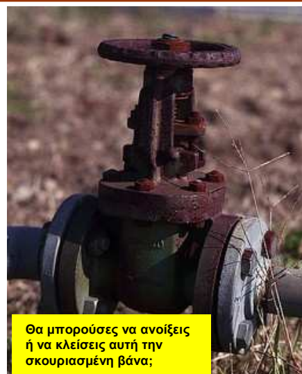
Θα μπορούσες να ανοίξεις ή να κλείσεις αυτή την σκουριασμένη βάνα;

Οι εικόνες παρουσιάζουν παραδείγματα προβλημάτων που μπορεί να παρατηρήσουμε στο εργοστάσιο.