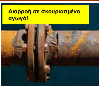
Διαρροή σε σκουριασμένο αγωγό!