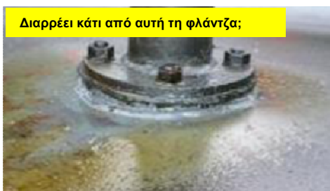
Διαρρέει κάτι από αυτή τη φλάντζα;