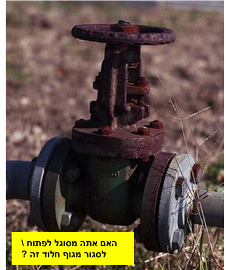
האם אתה מסוגל לפתוח \ לסגור מגוף חלוד זה ?

אימרה ידועה : " אתה יכול לגלות הרבה רק ע"י הסתכלות " . זה נכון גם לגבי בטיחות . ניתן ללמוד הרבה על מצב התהליך מצפיה והאזנה . רעשים חריגים מצביעים על צפי לבעיות בציוד . כתמי נוזלים ונקודות מלוכלכות מהתזות יכולים להצביע על דליפות . ידוע שדליפות ונדילות לא מתקנים את עצמם לבד... דווח על דליפות אלו – היכן נצפו ומה מקורן . דווח בכתב ובעל פה לממונה . ראה למטה מספר דוגמאות של מצבים שאותם יש לדווח :