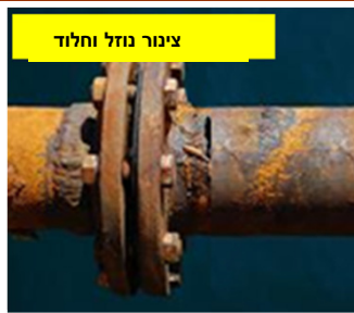
צינור נוזל וחלוד