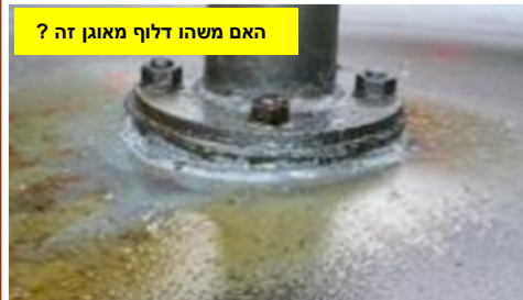
האם משהו דליף מאוגן זה ?