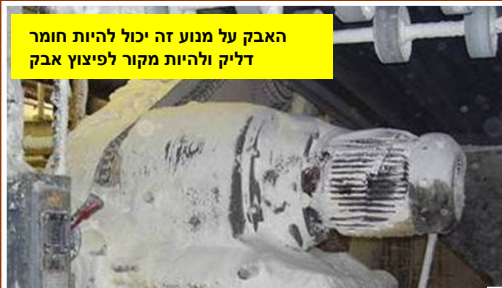
האבק על מנוע זה יכול להיות חומר דליק ולהיות מקור לפיצוץ אבק