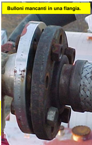
Bulloni mancanti in una flangia.