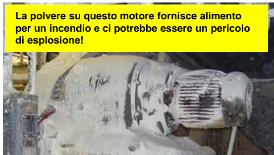
La polvere su questo motore fornisce alimento per un incendio e ci potrebbe essere un pericolo di esplosione!