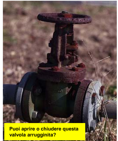
Puoi aprire o chiudere questa valvola arrugginita?

Le fotografie illustrano esempi di problematiche che puoi osservare nel tuo impianto.