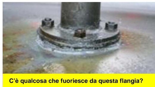
C'è qualcosa che fuoriesce da questa flangia?