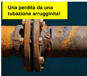
Una perdita da una tubazione arrugginita!