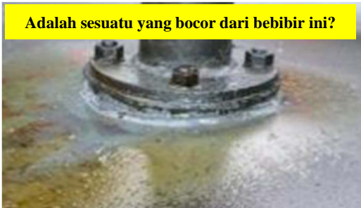
Adalah sesuatu yang bocor dari bebibir ini?