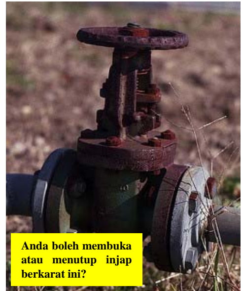
Anda boleh membuka atau menutup injap berkarat ini?

Gambar-gambar yang menunjukkan contoh-contoh masalah yang anda mungkin lihat di dalam loji anda.