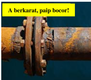
A berkarat, paip bocor!