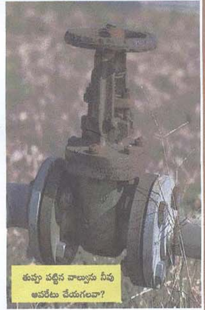
తుప్పు పట్టిన వాల్వలను నీవు ఆపరేటు చేయగలవా?

కర్మాగారాలలో కార్మికుల నుంచి ఎక్కువగా వినిపించే విమర్శ ఇదే, “ఉత్పత్తి ప్రక్రియలో భద్రత విధానాన్ని అభివృద్ధి చేయడానికి నేనేమి చేయాలి? నేను ఒక చిన్న ఆపరేటరును (టెక్నిషియన్, మెకానిక్ మొ. వారు) నా వృత్తి కేవలం వాల్వలను త్రిప్పుడం, యంత్రాలను పనిచేయించడం, పంప్స్ను తీసుకోవడం, రెంచ్లను త్రిప్పుడం, యంత్ర పరికరములను సరిచేయడం మాత్రమే. అయితే ఆపరేటర్లు, నిర్వహణ సిబ్బంది కర్మాగారపు పనివిధానాలను ప్రభావితం చేయలేరు మరియు డిజైన్ మార్పులకు సాధ్యం కాదనీ, యంత్ర పరికరాల యొక్క తయారీలో వాడే మెటల్స్ను మార్పుడం సాధ్యం కాదనీ సత్యం. అయితే, కార్మికులకు ఉత్పత్తి విధానంపై సమగ్రమైన పరిశీలన/అవగాహన కలిగి ఉంటారు. వారికి యంత్రాల యొక్క పనితీరు, ఏ పరిస్థితులలో యంత్రాలు ఎలా పనిచేస్తాయి, మొదలగు విషయాలు మరియు ఉత్పత్తి ప్రక్రియకు ఏ పరిస్థితులు అనుగుణమో ఖచ్చితంగా తెలిసి ఉంటుంది.