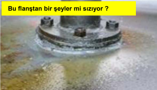
Bu flanştan bir şeyler mi sızıyor ?