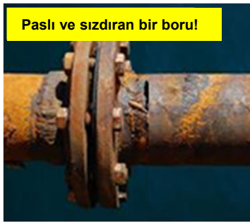
Paslı ve sızdıran bir boru!