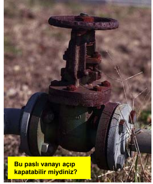
Bu paslı vanayı açıp kapatabilir miydiniz?

Resimler tesisinizde gözlemleyebileceğiniz benzer problem örneklerini gösteriyor.