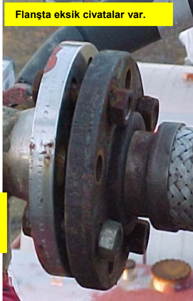
Flanşta eksik civatalar var.