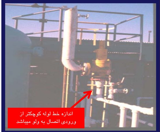
اندازه خط لوله کوچکتر از ورودی اتصال به ولو میباشد