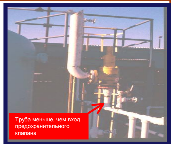
Труба меньше, чем вход предохранительного клапана

Не давайте вашим предохранительным клапанам дребезжать!