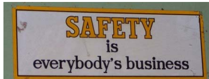
Sopra: un cartello nella control room dell'impianto.

Ci furono molti errori alcuni nella progettazione, altri nella gestione e nella cultura della sicurezza, e, inoltre, le attività dell'impianto contribuirono alla tragedia. Si possono trovare molte fonti su Internet che descrivono dettagliatamente l'incidente. Prendetevi del tempo questo mese per conoscere l'incidente, e che cosa rappresenta per voi nel vostro lavoro.