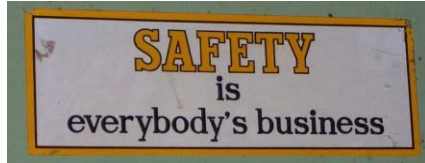
Вверху: Знак в контрольном помещении завода «Безопасность – дело каждого»

Было найдено много несоответствий в проекте, в управлении, культуре безопасности и работе завода, которые внесли вклад в трагедию. Вы можете найти много хороших ресурсов в интернете, которые подробно описывают происшествие. Потратьте некоторое время в течение этого месяца, чтобы изучить этот инцидент и его значение для вас на вашей работе.