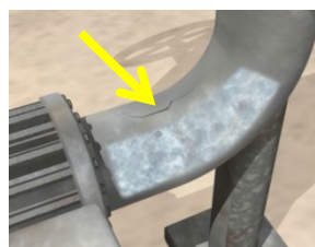
這是管子的裂痕嗎？