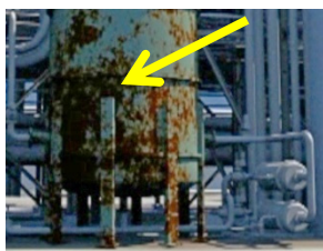
這儲槽看起來生鏽並且腐蝕！