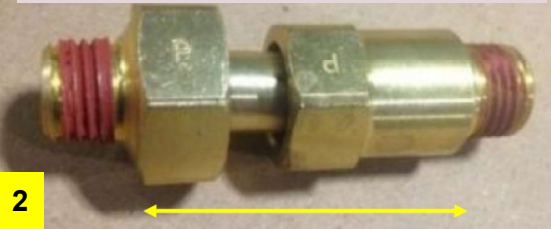
Cuplaj cu lungime variabila cu filet exterior