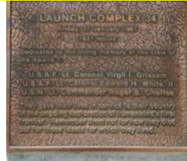
نشان یادبود در محل پرتاب