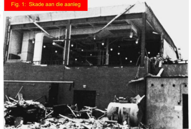
Fig. 1: Skade aan die aanleg

[verwysing: Kohlbrand, H. T., Plant/Operations Progress 10 (1), pp. 52-54 (1991).]