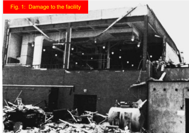
Fig. 1: Damage to the facility

[Reference: Kohlbrand, H. T., Plant/Operations Progress 10 (1), pp. 52-54 (1991).]