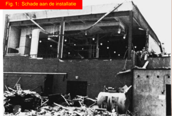
Fig. 1: Schade aan de installatie

Maar de brandbare stof hoeft niet alleen in vorm van damp aanwezig te zijn (denk b.v. aan stof explosies). Het onderzoek wees uit dat het roerwerk in de reactor een fijne nevel van vloeistofdruppels vormde (Fig. 2). Deze zeer kleine druppels hadden een geschatte gemiddelde grootte van ongeveer 1 micrometer. Ter vergelijking de diameter van een menselijke haar is 40 tot 50 keer groter dan deze kleine mist druppels. Onderzoek naar de brandbaarheid liet zien dat deze mist van druppels ontstoken kon worden in lucht bij omgevingstemperatuur – en zelfs nog gemakkelijker in een zuivere zuurstof omgeving. De reactor bevatte dus zowel brandstof als zuurstof – maar wat was de ontstekingsbron? Hoewel een ontstekingsbron vaak moeilijk te achterhalen is, liet het onderzoek zien dat een verontreiniging – achtergebleven na een vorig experiment – de meest waarschijnlijke ontstekingsbron was, aangezien deze verontreiniging ontleedde en zo veel energie genereerde dat de mist van fijne druppels ontstoken kon worden.