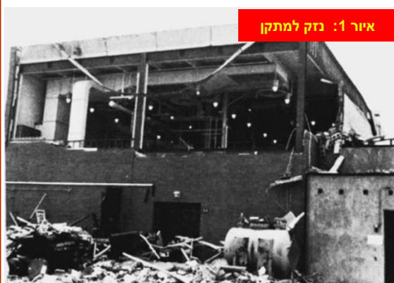
איור 1: נזק למתקן

בשנת 1986, אירע פיצוץ במיכל בחוש בנפח 38 ליטר במתקן חצי חרושתי (פיילוט). זה קרה במהלך תגובת חמצון תחת אווירה של חמצן טהור בלחץ של 18 בר. היו סבורים שלא הייתה סכנה של הצתת החלל בכלי מפני שטמפרטורת העבודה הייתה 50 מעלות צ' מתחת לנקודת ההבזק של תכולת הכלי בתוך אווירת חמצן, וריכוז אדי הדלק היה מתחת לריכוז המינימלי הנדרש לפיצוץ (LEL). תנאי העבודה היו יציבים במשך 41 דקות כאשר פתאום אירע הפיצוץ. הפיצוץ פרץ את הכלי שתוכנן ל-52 בר, גרם נזק מהותי למתקן (איור 1) והצית מספר שרפות קטנות. למרבה המזל לא היו נפגעים.