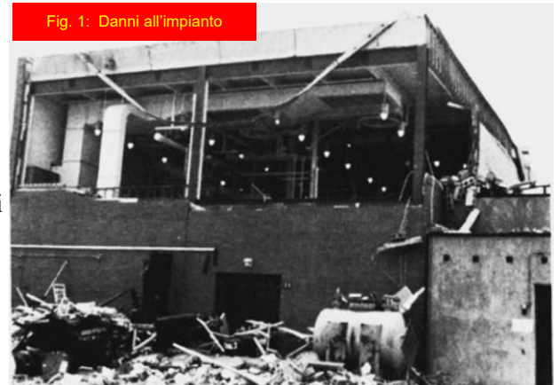
Fig. 1: Danni all'impianto

[Riferimento: Kohlbrand, H. T., Plant/Operations Progress 10 (1), pp. 52-54 (1991)]