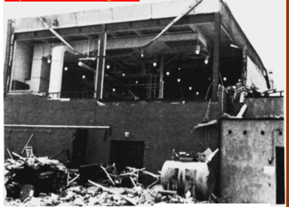
आकृती 1: संयंत्राचे झालेले नुकसान

टाकीमधील कामकाज त्या टाकीमधील घटक रसायनांच्या ज्वलनांक बिंदूपेक्षा कमी तापमानावर चालू होते त्यामुळे टाकीमधील इंधनाच्या वाफांची सघनता ज्वलनाच्या दृष्टीने अत्यंत कमी होती. तेथे स्फोटाच्या धोक्याची सुतराम शक्यता नव्हती. परन्तु फक्त वाफेच्या रूपातील इंधन तेथे उपलब्ध असेल असे नाही (धुळीचा स्फोट आढवा). चौकशीमध्ये असे निश्चित झाले की एजिटेटेरमुळे द्रवाच्या थेंबाचे धुके निर्माण झाले होते. (आकृती 2). सूक्ष्म थेंबकणांचा सरासरी आकार सुमारे 1 मायक्रॉन एवढा होता. तुलनेमध्ये मानवी केसाचा व्यास धुक्यातील थेंबकणांपेक्षा 40-50 पटीने मोठा असतो. ज्वलनशीलतेच्या चाचणीमध्ये निष्पन्न झाले की हवेमधील धुके वातावरणीय तापमानाला पेट घेवू शकते आणि शुद्ध ऑक्सिजनच्या वातावरणामध्ये धुके अधिक सहजतेने पेट घेवू शकते. टाकीमध्ये इंधन आणि ऑक्सिजन दोन्ही उपस्थित होते - पण आगीचा स्रोत कोणता होता? जरी एखाद्या स्फोटासाठी आगीचा स्रोत हुडकणे सहसा अवघड असले तरी चौकशीमध्ये असे निश्चित झाले की सर्वसंभाव्य आगीचा स्रोत हा टाकीतील एक प्रदूषक होता, जो टाकीमधील अगोदरच्या प्रयोगांच्यावेळी राहून गेला आणि विघटीत होऊन त्यात धुके पेटण्याइतपत उष्णता निर्माण झाली.