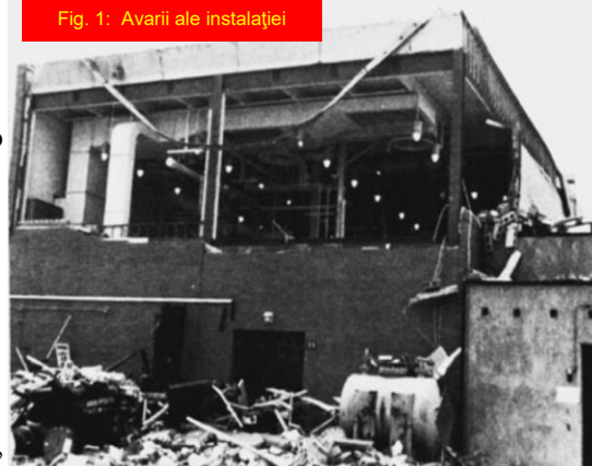
Fig. 1: Avarii ale instalației

în interiorul recipientului a fost redusă pentru a se aprinde. Nu ar fi fost pericol de explozie. Dar reamintiți-vă, combustibilul poate fi prezent nu numai sub formă de vapori (amintiți-vă de exploziile provocate de praf). Investigația a scos la iveală că agitatorul recipientului a creat o ceață fină de picături de lichid (Fig. 2). S-a estimat că dimensiunile medii ale picăturilor erau de 1 micron. Prin comparație, diametrul părului uman este de 40-50 ori mai mare decât picăturile de ceață. Testul de inflamabilitate a demonstrat că ceața se putea aprinde în aer la temperatura camerei, iar ceața s-ar fi aprins mult mai ușor în atmosfera pură de oxigen. Recipientul conținea atât combustibil cât și oxigen, dar totuși care a fost sursa de aprindere? Deși este foarte dificil să identifici sursa de aprindere pentru o explozie, investigația a stabilit că cea mai probabilă sursă de aprindere a fost un contaminant, lăsat în recipient de la un experiment anterior, contaminant care a descompus și a generat suficientă căldură pentru a aprinde ceața.