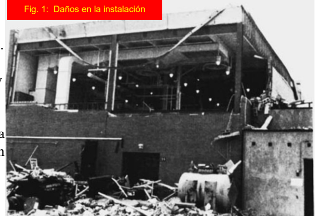
Fig. 1: Daños en la instalación

Debido a que el reactor funcionaba por debajo del punto de inflamación del contenido, la concentración de vapor de combustible en el reactor era demasiado baja para inflamarse. No debería haber habido riesgo de explosión. Pero el combustible no sólo puede estar presente como vapor (recuerde explosiones de polvo). La investigación determinó que el agitador del reactor creó una fina niebla de gotas de líquido (Fig. 2). Se estimó que las gotitas diminutas tenían un tamaño medio de aproximadamente 1 micra. En comparación, el diámetro de un cabello humano es 40-50 veces mayor que las gotitas de niebla. Los ensayos de inflamabilidad demostraron que la niebla podía inflamarse a temperatura ambiente en aire - y la niebla se inflamaría aún más fácilmente en una atmósfera de oxígeno puro. El reactor contenía ambos, combustible y oxígeno, pero ¿cuál fue la fuente de ignición? Aunque a menudo es difícil identificar la fuente de ignición de una explosión, la investigación determinó que la fuente de ignición más probable era un contaminante de un experimento anterior, que se habría quedado en el reactor, que se descompuso y generó suficiente calor para inflamar la niebla.