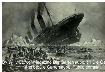
By Willy Stöwer-Magazine Die Gartenlaube, en:Die Gartenlaube, and de:Die Gartenlaube, Public domain.