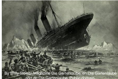
By Willy Stöwer; Magazine Die Gartenlaube, en:Die Gartenlaube and de:Die Gartenlaube, Public domain.