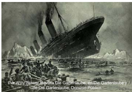
Por Willy Stöwer, Revista Die Gartenlaube, en Die Gartenlaube y de Die Gartenlaube, Dominio Público.