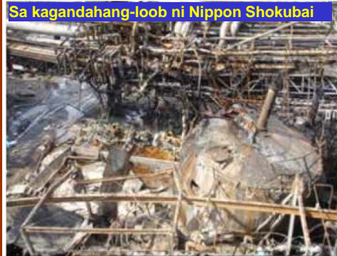
Larawan 1: Nawasak na AA Tank