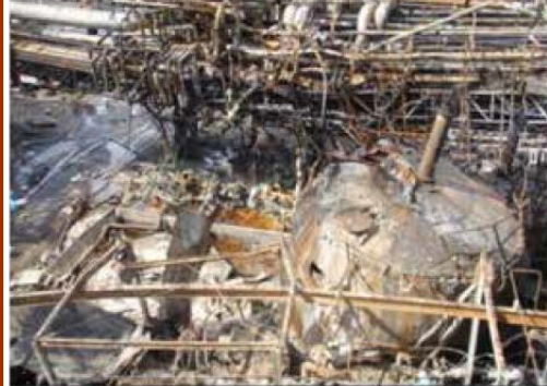
사진 1: 파손된 AA 탱크