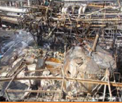
फोटो १: उध्वस्त एएची टाकी

स्फोटाच्या वेळी कारखान्यात पुढील प्रक्रियेतील उर्ध्वपतन स्तंभाची चाचणी करण्याचे काम चालू होते ज्यासाठी टाकीतून पुरवठा बंद करणे आवश्यक होते. टाकीमधील पातळी हळुहळू वाढून प्रचालनाच्या मूळ पातळीपर्यंत पोचली. टाकीचे रिसायकल चालू नसल्यामुळे कूलिंग कॉइलच्या वरील एए मिसळले व थंड झाले नव्हते. आत येणाऱ्या एए चे तापमान पॉलिमरायझेशन ज्या तापमानाला सुरु होते त्यापेक्षा कमीच असणार असे गृहीत धरले होते. तथापि टाकीतील मुख्यतः वरच्या भागातील तापमान वाढले. अखेरीस टाकीतील दाब अतिशय वाढला आणि स्फोट झाला.