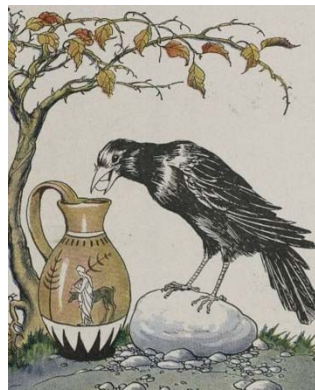
Aesop se storie van die kraai en die kruik herinner ons aan die waarde van vindingrykheid.