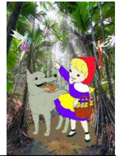
Rooikappie en die wolf