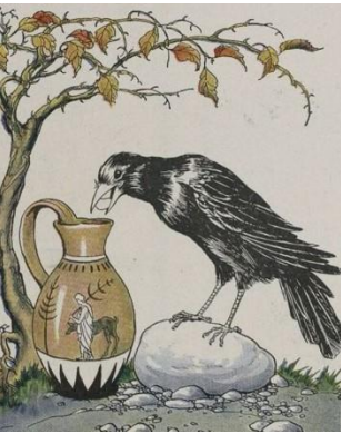
تذكرونا حكاية الغراب والجرة بقيمة الإبداع.