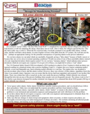
Beacon-ul din Octombrie 2017 se bazează pe fabula lui Aesop a băiatului care luptă cu lupul

corespunzător. Fără această experiență, ne bazăm pe instruire, exerciții și proceduri privind modul în care putem lucra în siguranță în fiecare zi. Atunci când nu există o legătură bună între "ce să faci" și "de ce facem așa", putem deveni mulțumiți. De ce trebuie să urmărim toate aceste proceduri de gestionare a siguranței proceselor pentru a preveni incidentele care nu se întâmplă niciodată? Uităm că incidentele nu se întâmplă atât de des pentru că respectăm procedurile necesare. Procedurile devin vulnerabile în a nu fi urmate riguros. Complacerea și nerespectarea procedurilor sunt unii dintre primii pași pe o cale care duce la un incident viitor.