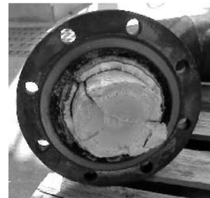
شکل ۱: گرفتگی مسیر ونت

هیئت بررسی حوادث شیمیایی در آمریکا (CSB) حادثه ای را بررسی کرد که در اثر اختلالات فرآیندی مسیر ونت (شکل ۱) و مسیر کاهش فشار بر روی مخزن تعادل ضایعات (Waste Surge Tank) دچار گرفتگی گردید. زمانی که کارکنان تعمیرات برای باز کردن و تمیز نمودن مخزن مراجعه کردند، فشار باقیمانده در سیستم باعث پرتاب شدن درپوش (شکل ۲) شده و هر سه نفر را به کام مرگ کشاند. چرا این حادثه به وقوع پیوست؟ چرا زمانی که مخزن تحت فشار بود کارکنان تعمیرات درب آن را باز کردند؟ در هنگام راه اندازی فرآیند محصولات فاقد کیفیت (Off-Spec) به مخزن ارسال شده بود و گاز حاصله نیز در مخزن تجمع یافته است. سپس مسدود شدن مسیر سیستم کاهش فشار باعث شده تا فشار مخزن افزایش یابد. نشانگر فشار (Gauge) نیز دچار گرفتگی بوده و بنابراین هیچگونه فشاری را نشان نداده است.