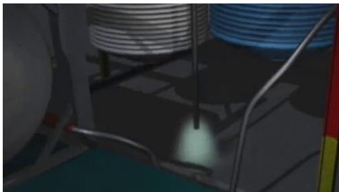
Rajah 2. Wap proses dilepas keluar pada aras rendah berhampiran kawasan proses

Pada 12 April 2004, sebuah syarikat di Dalton Georgia, USA diberi kontrak untuk membuat tri-alil sianurat. Satu tindak balas luar kawalan berlaku, dan alil alkohol dan alil klorida yang mudah terbakar dan bertoksik dilepaskan ke atmosfera. Sebahagian bahan dilepaskan melalui manway yang tidak tertutup rapat (Rajah 1) dan selebihnya lagi melalui bolong rupture disc (Rajah 2). Pelepasan itu memaksa pengungsian lebih dari 200 buah keluarga di komuniti sekitar.