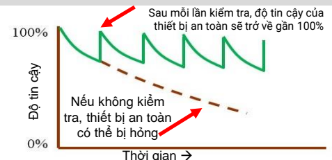
Hình 4: Độ tin cậy của thiết bị an toàn (Cảnh báo H 2 S)