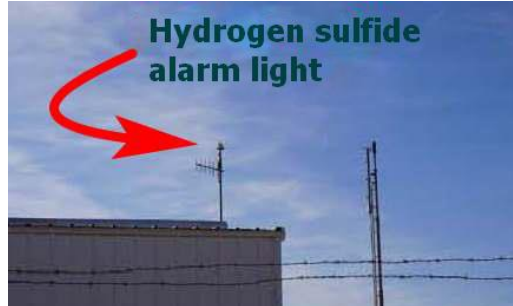
Hình 2: Đèn cảnh báo khí H 2 S